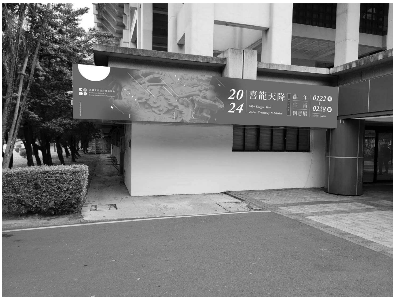
至真三館戶外帆布