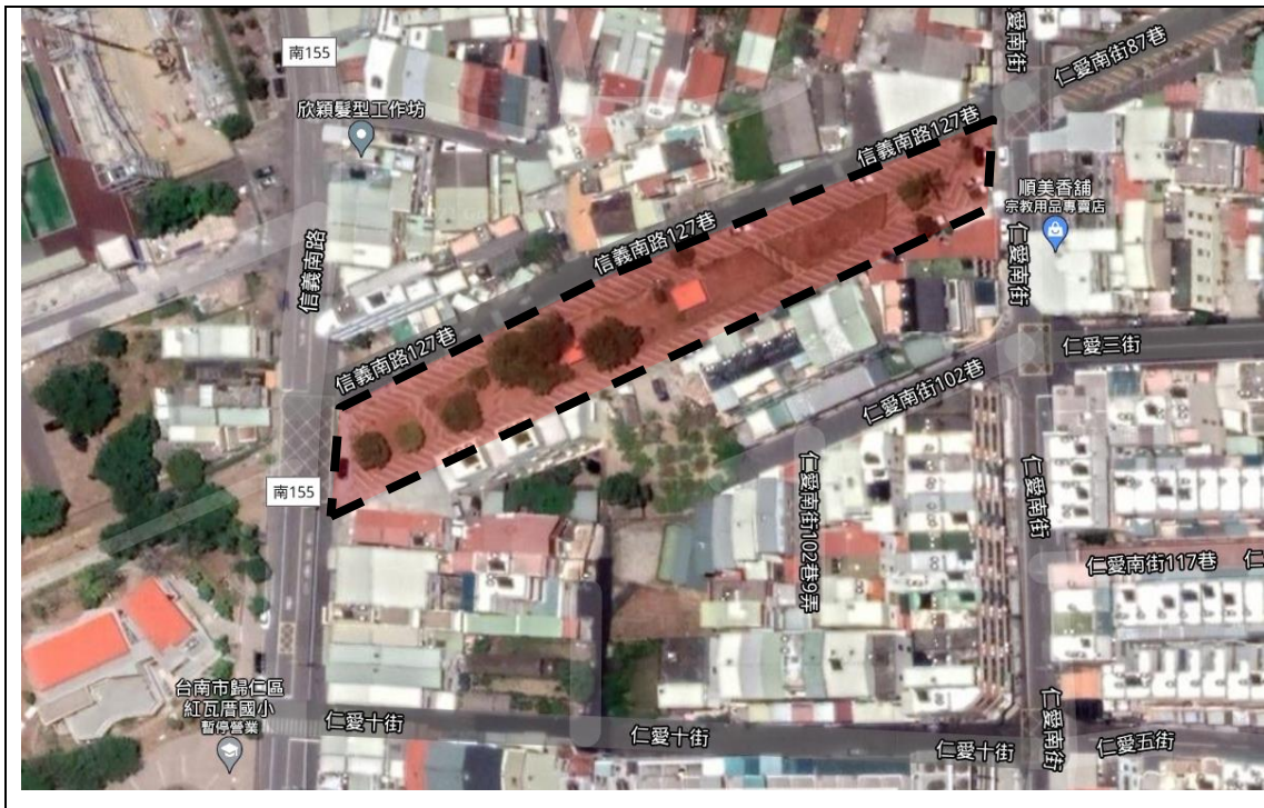
圖 2、建議設置範圍位置圖(台南市歸仁區信義南路 127 巷)