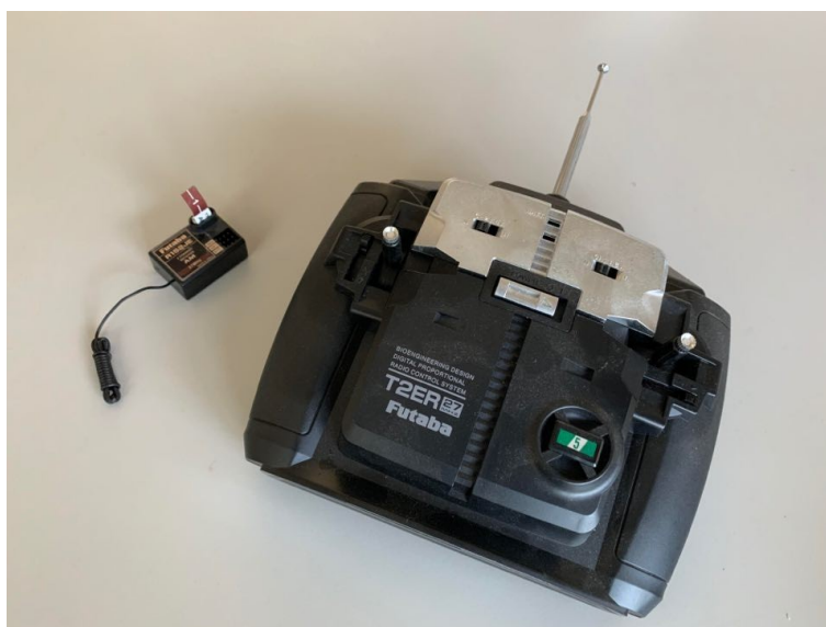
市售 3 通道 27MHz 板型遙控收發器