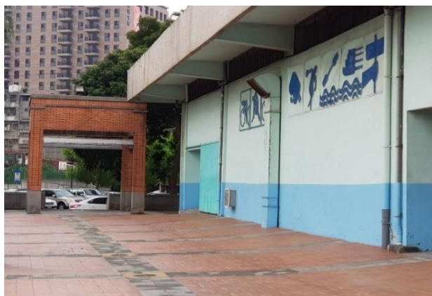
館外：設立廠商展位、宣傳、指示