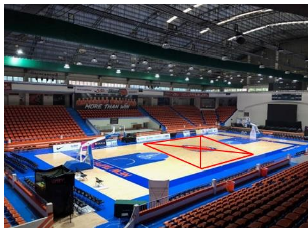
主舞臺1：設於場中央；周邊看板贊助商廣告