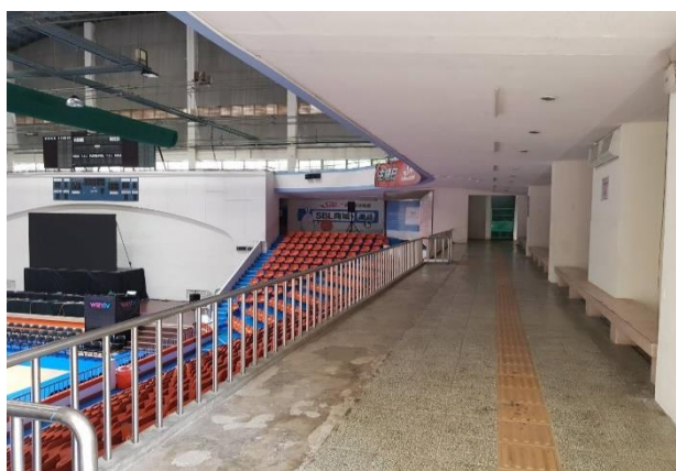
走道：設立廠商展位