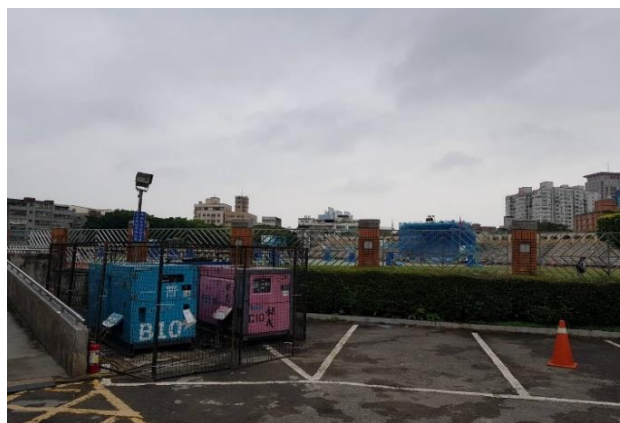
發電機租借：於場外，停車場旁