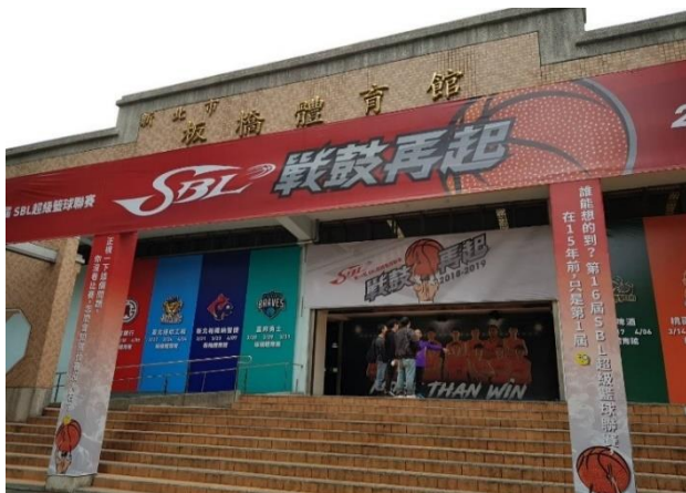
大門入口：廣宣包裝