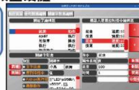
GUI 吸引學生 AI 課程績效有保證

https://www.playrobot.com/most-popular/2164-arduino-raspberry-pi-respeaker-python.html