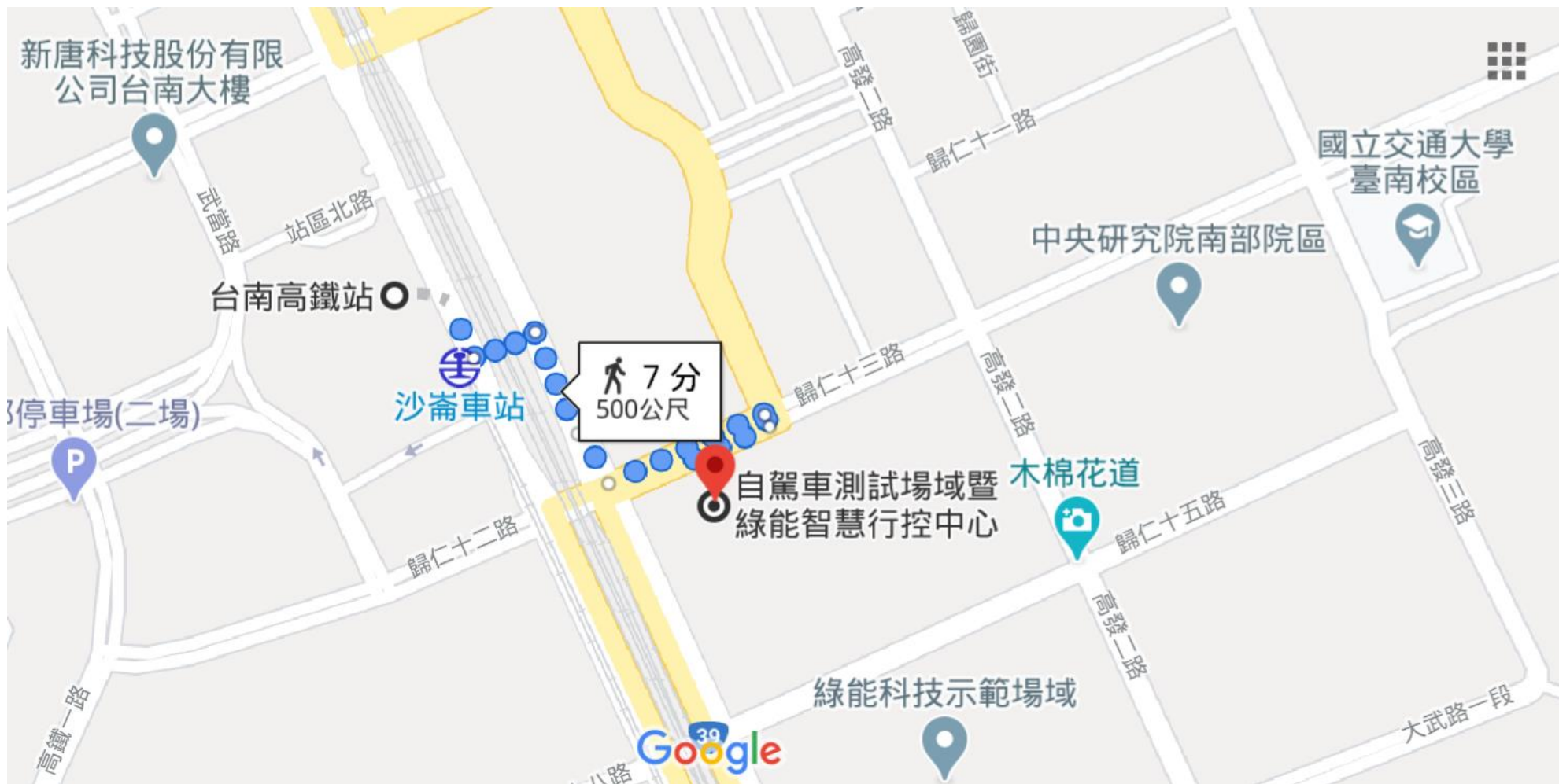
臺灣智駕測試實驗室 (沙崙自駕車場域) 位置