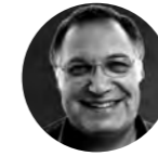
Yaacov Hecht 雅各布·赫克特 ISRAEL 以色列

以色列世界第一間以民主教育為名的學校Education Cities 董事長/擁有者 IDEC第一屆國際民主教育年會召集人 以色列民主教育學院創辦人