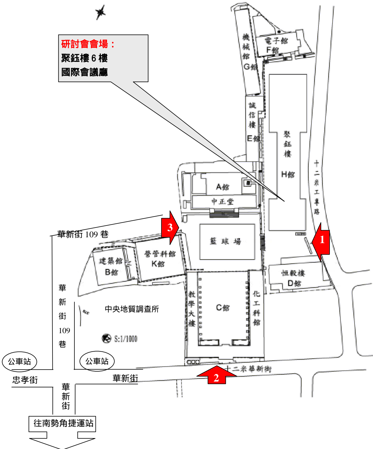
華夏技術學院校區平面圖

華夏技術學院中和校區入口有三處：(1)工專路正門、(2)華新街大門、(3)華新街 109 巷側門。 若您前來，可由 (2)華新街大門 或(3)華新街 109 巷大門步行進入校園，較為方便。